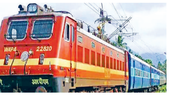
रेवाड़ी। उत्तर-पश्चिम रेलमार्ग से गुजरती एक्सप्रेस ट्रेन।