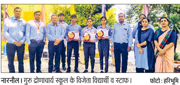
नारनौल। गुरु द्रोणाचार्य स्कूल के विजेता विद्यार्थी व स्टाफ।

बैंक प्रबंधकों के साथ बैठक में बैंक एटीएम सुरक्षा व्यवस्था को लेकर चर्चा की गई। सुरक्षा व्यवस्था के तहत बैंक परिसरों और एटीएम बूथों पर उच्च गुणवत्ता वाले सीसीटीवी कैमरे हों तथा यह सुनिश्चित करने पर जोर दिया गया कि वे हर समय कार्यरत रहें। फुटेज का नियमित रूप से निरीक्षण किया जाए। इसके अतिरिक्त सभी बैंक शाखाओं व एटीएम में एक त्वरित प्रतिक्रिया अलार्म प्रणाली को सक्रिय रखने का निर्देश दिया गया, ताकि किसी भी आपात स्थिति में स्थानीय पुलिस स्टेशन को तुरंत सूचित किया जा सके। बैंकों को नकली जमा करके, निकालने के दौरान मानक सुरक्षा प्रोटोकॉल का सख्ती से पालन करने तथा सख्ती गतिविधियों पर तुरंत रिपोर्ट करने को कहा।