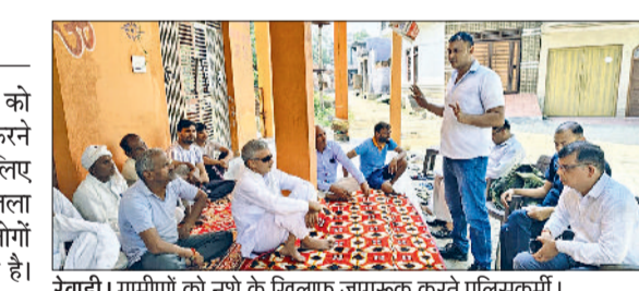
रेवाड़ी। ग्रामीणों को नशे के खिलाफ जागरूक करते पुलिसकर्मी।

जिला पुलिस ने युवाओं व आमजन को नशे के दुष्प्रभावों के बारे में जागरूक करने के लिए और खेलों से जोड़ने के लिए विशेष अभियान चलाया हुआ है। जिला पुलिस की नशा मुक्त टीम रोजाना लोगों को नशे के विरुद्ध जागरूक कर रही है। पुलिस टीम नशा पीड़ितों की पहचान करके व काउंसिलिंग करार नशा छोड़ने के लिए प्रेरित कर रही है। शुक्रवार को पुलिस टीम ने विद्यार्थी स्कूल गाँव पाल्हावास, हेरिटेज गैलेरीसी इंटरनेशनल स्कूल गाँव करावरा मानकपुर व गाँव अमोल जीवन समय से पहले ही नशा से बचाने का शिकार हो जाता है। नशा करने वाला व्यक्ति अपने साथ साथ पूरे परिवार का जीवन खराब कर देता है। सबसे पहले युवा पीढ़ी को नशे से बचना होगा। पुलिस के इस अभियान से प्रेरित होकर जहाँ युवा शिक्षा और खेल गतिविधियों की ओर अग्रसर हो, वहाँ नशा गस्त युवकों ने नशा छोड़ने की पहल भी की है, जिनका प्रयास की मदद से इलाज करार उन्हें फिर से समाज की मुख्यधारा में शामिल किया गया है।