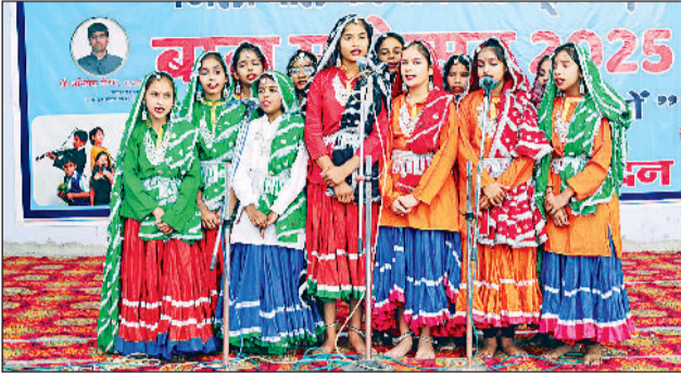
रेवाड़ी। पेट्रियोटिक ग्रुप साँगा में भाग लेती छात्राएं रेवाड़ी व बाल महोत्सव में रंगोली बनाते हुए छात्रा और विद्यार्थियों की रंगोली का अवलोकन करते डीसी व एडीसी।