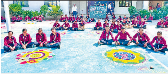
नारनौल। रंगोली बनाते विद्यार्थी।

सैनी का वर्चुअल माध्यम से संदेश सुना गया। इस अवसर पर जिले के नौ गांवों के 306 लाभार्थियों को मुख्यमंत्री ग्रामीण आवास योजना के आवंटन पत्र वितरित किए गए। सांसद ने बधाई देते हुए कहा कि देश व प्रदेश में अंत्योदय की परंपराओं के अनुरूप सर्वव्यापी