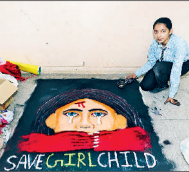
रेवाड़ी। पेट्रियोटिक ग्रुप साँगा में भाग लेती छात्राएं रेवाड़ी व बाल महोत्सव में रंगोली बनाते हुए छात्रा और विद्यार्थियों की रंगोली का अवलोकन करते डीसी व एडीसी।

बाल महोत्सव का आयोजन 30 अक्टूबर तक किया जा रहा है। इस दौरान विभिन्न प्रतियोगिताओं में जिले के 150 से अधिक स्कूलों के विद्यार्थी अपनी प्रतिभा का प्रदर्शन कर रहे हैं। शुक्रवार की प्रतियोगिताओं में जिले के 43 गैर सरकारी एवं 3 सरकारी विद्यालयों से 387 बच्चों ने भाग लिया। उन्होंने बताया कि 23 अक्टूबर को पेट्रियोटिक ग्रुप साँगा चतुर्थ वर्ग, क्लासिकल सोलो डांस तृतीय व