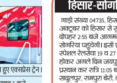
रेवाड़ी रेलमार्ग से गुजरते हुए एक्सप्रेस ट्रेन।

गाड़ी संख्या 09601 उदयपुर सिटी-दिल्ली सराय स्पेशल रेलसेवा 18 व 26 अक्टूबर को उदयपुर सिटी से सुबह 10:30 बजे रवाना होकर जयपुर स्टेशन पर शाम 7:15 बजे आगमन व 7:25 बजे प्रस्थान करके अगले दिन रात्रि 2:20 बजे दिल्ली सराय पहुंचेगी। इसी प्रकार गाड़ी संख्या 09602 दिल्ली सराय-उदयपुर सिटी स्पेशल रेलसेवा 19 व 27 अक्टूबर को दिल्ली सराय से सुबह 5 बजे रवाना होकर जयपुर स्टेशन पर सुबह 11:30 बजे आगमन व 11:40 बजे प्रस्थान करके अगले दिन रात्रि 9:20 बजे उदयपुर सिटी पहुंचेगी। यह रेलसेवा मार्ग में राणाप्रतापनगर, मावली, फतेहनगर, कपासन, चंदेरिया, गंगार, मीलवाडा, मांडल, बिजानगर, नसीरबाद, अजमेर, दिशानगर, नरेना, फुरेला, आसलपुर जोबनेर, कनकपुरा, जयपुर, गांधीनगर जयपुर, गैटोर जगतपुर, खातीपुरा, बस्सी, दौसा, बांदीकुई, राजगढ़, मालाखेडा, अलवर, खैरथल, रेवाड़ी, गुरुग्राम व दिल्ली कैंट स्टेशनों पर ठहराव करेगी। इस रेलसेवा में 2 थर्ड एसी, 8 द्वितीय शयनयान, 4 साधारण श्रेणी व 2 गाई डिब्बों सहित कुल 16 डिब्बे होंगे।