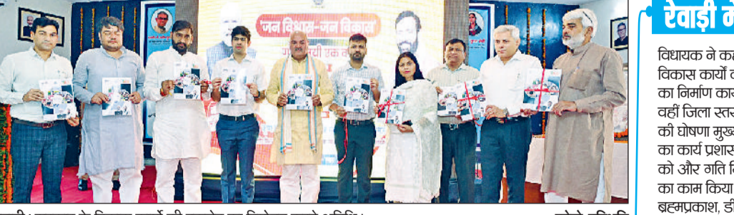
रेवाड़ी। सरकार के विकास कार्यों की बुकलेट का विमोचन करते अतिथि।