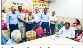
रेवाड़ी। कार्यक्रम में वरिष्ठ सदस्यों का सम्मान करते हुए।