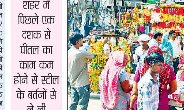
मोती चौक बाजार में खरीदारी करते हुए लोग

■ शहर में पिछले एक दशक से पीतल का काम कम होने से स्टील के बर्तनों से ले ली