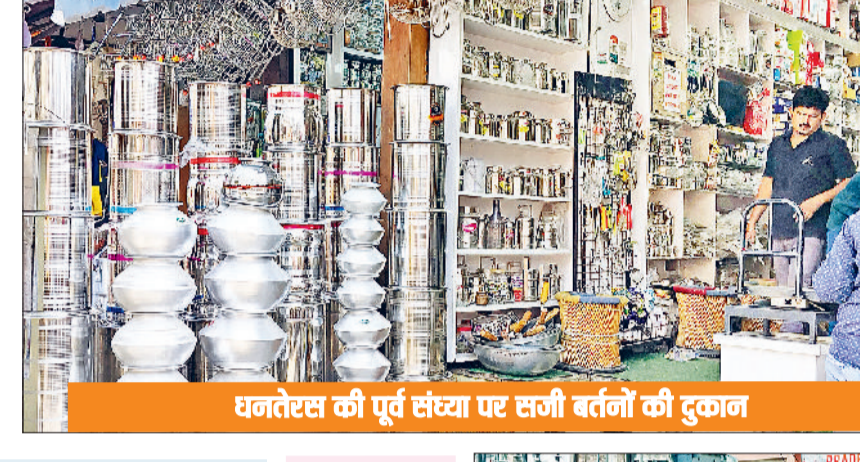
धनतेरस की पूर्व संस्था पर सजी बर्तनों की दुकान

■ इस बार धनतेरस पर दुकानदारों की ओर से पिछले वर्ष से अधिक बिक्री का अनुमान लगाया जा रहा