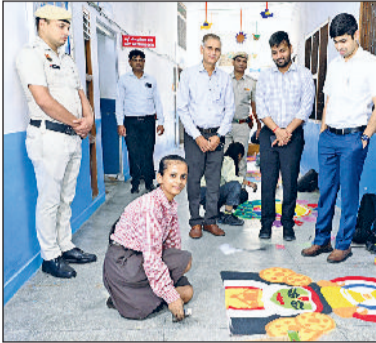
रेवाड़ी। पेट्रियोटिक ग्रुप साँगा में भाग लेती छात्राएं रेवाड़ी व बाल महोत्सव में रंगोली बनाते हुए छात्रा और विद्यार्थियों की रंगोली का अवलोकन करते डीसी व एडीसी।