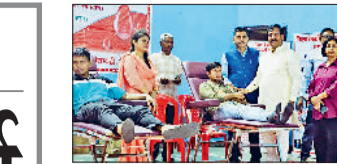
रेवाड़ी। कैप में रक्तदान करते हुए सफाईकर्मी।